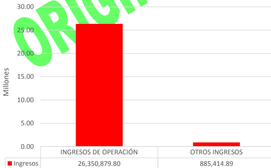
GRÁFICA 1 INGRESOS